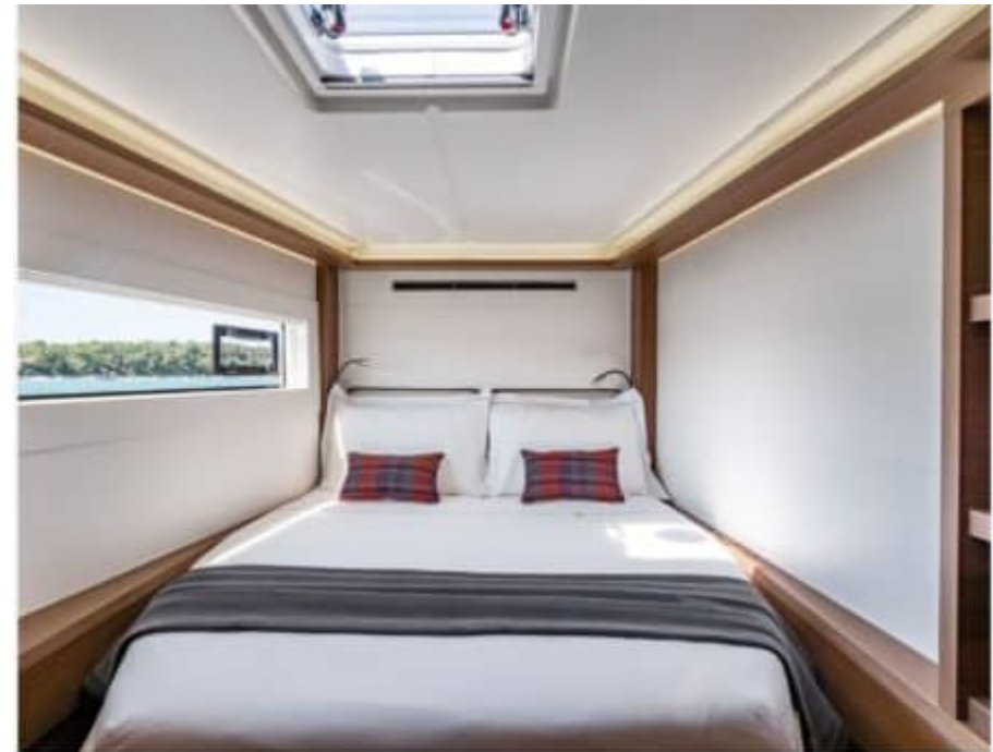
Figure 49 - Yacht Pelagia - Bedroom (cabin) - Yachting with Pelagia Yachts