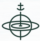
STABILISATEUR À L'ANCRE