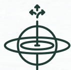
STABILISATEUR EN NAVIGATION